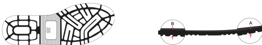
Vista do solado com desenho antiderrapante e número gravado

SOLA Peça integrante da base inferior do calçado. Deverá ser fabricado em "PU", Poliuretano poliéster de alta resistência a hidrólise, densidade moldada de 0,50 a 0,65 g/cm^3 , com dureza de 60\pm 5 Shore A, que lhe confere maior leveza e durabilidade devido a sua baixa densidade, alta resistência à abrasão, flexão e rasgo. Este solado deve ser na cor Preto, devendo ter a gravação da numeração em todos os tamanhos de forma permanente, e formato com canaletas antiderrapantes, similar à ilustração abaixo. E na sua base deve acompanhar o perfil da forma e ser em formato de cunha, com espessura dianteira ( Espessura A ) 5 milímetros, e espessura trazeira ( Espessura B ) 9 milímetros, tolerância admitida \pm 1 milímetro, isso deve ser seguido em todos os tamanhos. Conforme ilustração abaixo: