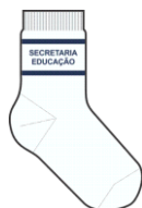
ILUSTRAÇÃO DO PRODUTO