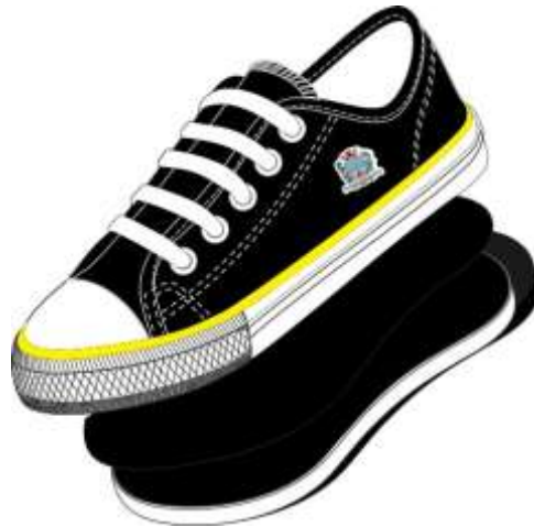
Vista externa (Foto Ilustrativa)

Tênis Escolar de Cadarço: O Tênis deve ser fabricado no processo de montagem ensacada, com fixação da palmilha ao cabedal pelo processo de costura Strobel (Overloque) e após ser AUTOCLAVADO, com vulcanização direta da borracha da banda lateral no solado e na lona do cabedal.